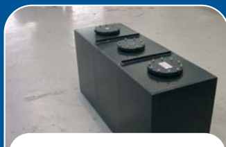
AANSLUITINGEN NAAR WENS