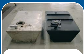
NAAR MODEL OF TEKENING